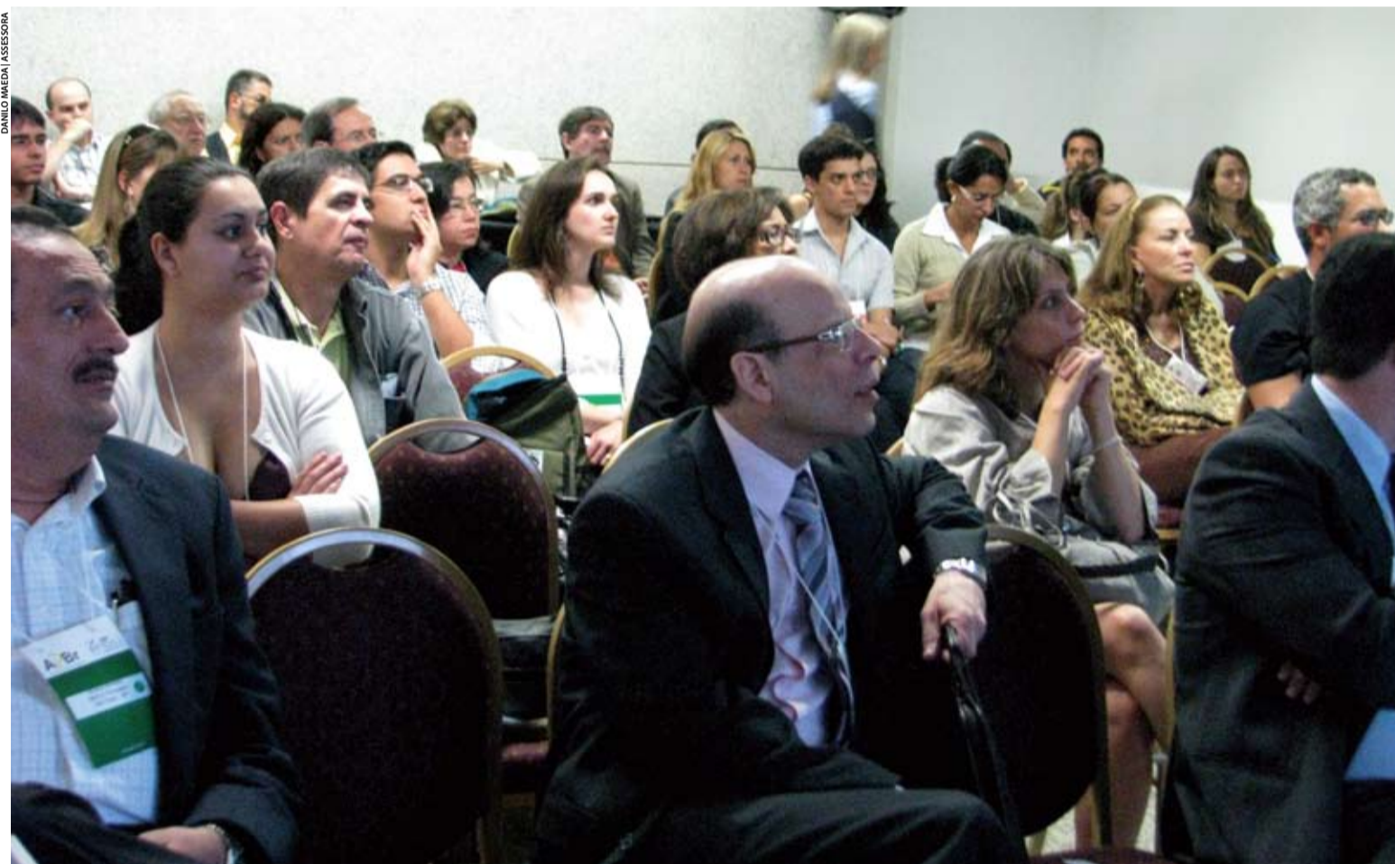
Evento realizado em Brasília reuniu cerca de 500 participantes, entre médicos, estudantes e profissionais de saúde

Capital federal foi sede de evento que teve cerca de 500 participantes. A última jornada regional de 2009 foi organizada em parceria pela Associação Brasileira de Psiquiatria e pela Associação Psiquiátrica de Brasília