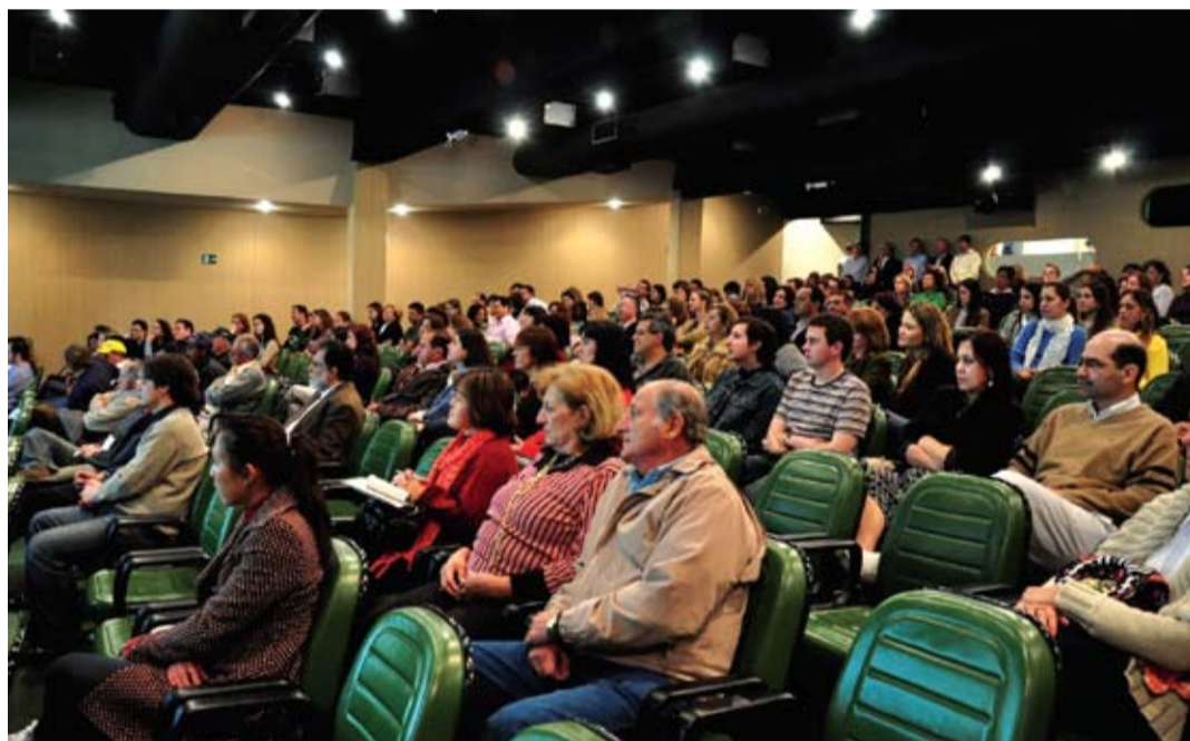
Encontro teve cerca de 200 inscritos para atividades científicas