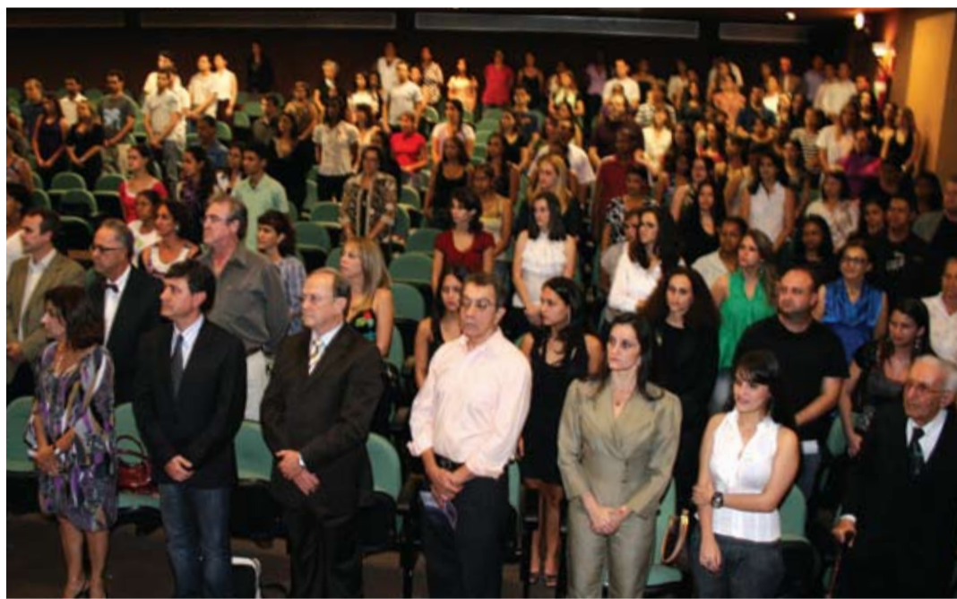
Evento sobre políticas de assistência teve 200 participantes