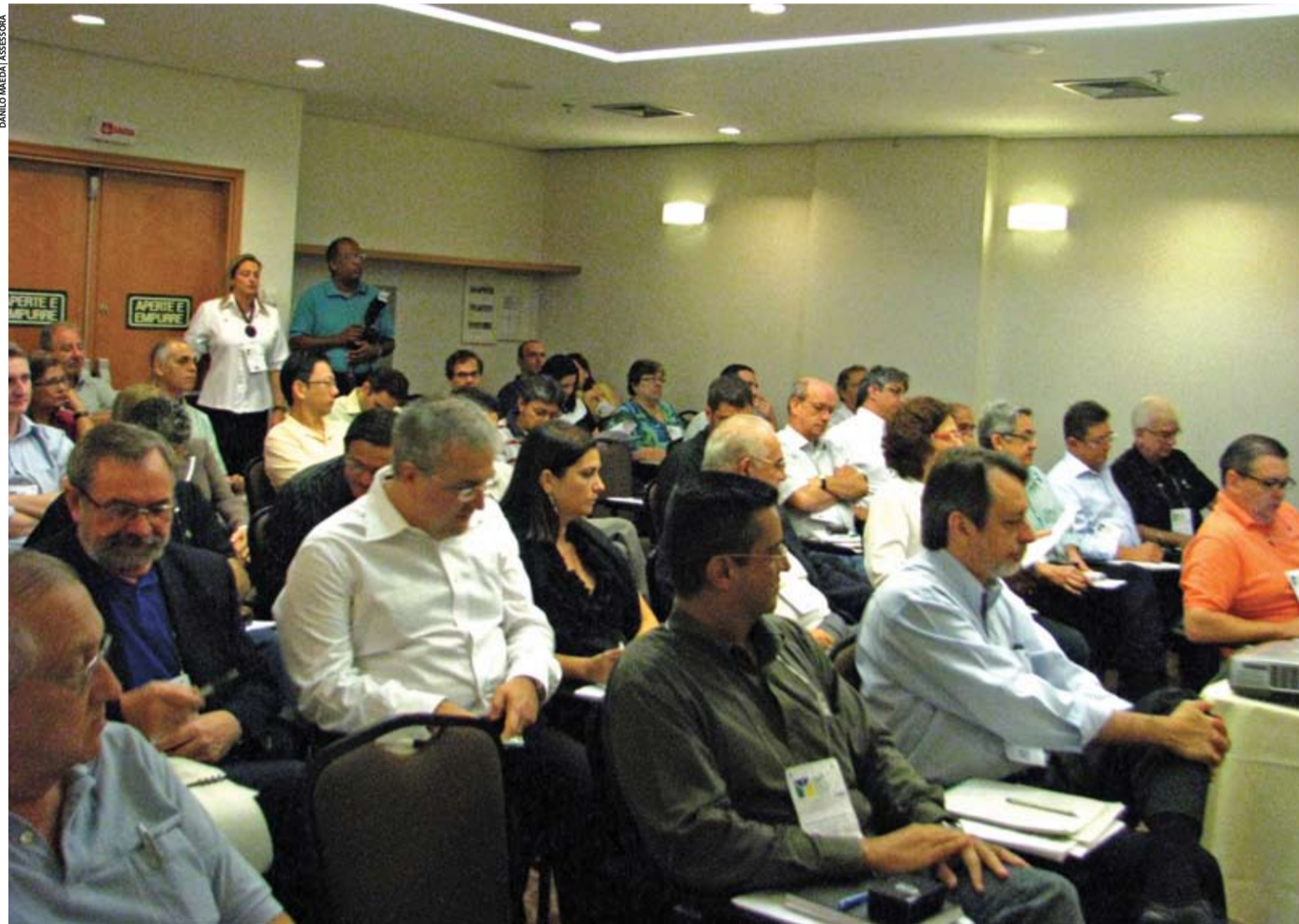
Representantes de federadas e núcleos da ABP participaram do Fórum Nacional

Encontro teve participação de diretores, secretários regionais e representantes das instituições que formam a Associação Brasileira de Psiquiatria